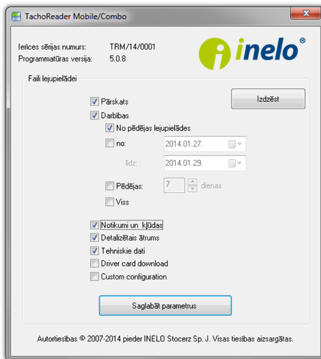
Zīm. Atslēgas konfigurācijas logs.