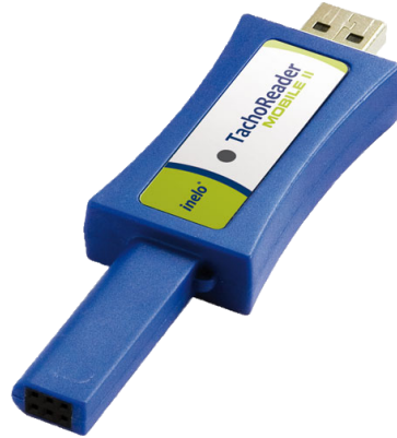
Zīm. TachoReader Mobile II.

TachoReader datu lejupielādes gaitā no tahogrāfa izmanto tā barošanu un neprasa nekādus citus elektriskās strāvas ārējos avotus. Tā ir neliela, viegli apkalpojama un lietošanā ērta ierīce.